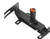
Wire spool holder

Гнездовой разъем для держателя катушки проволоки или барабана для проволоки.