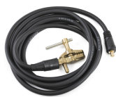
Earth return cable 70