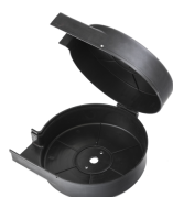
Protective cover for wire spool

Подходит для стандартной катушки с проволокой 15 кг. ПРИМЕЧАНИЕ. Гнездовой разъем для канала подачи проволоки не входит в комплект поставки. Эту позицию необходимо заказывать отдельно.