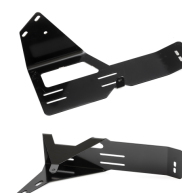
Wire feeder mounting brackets

Напольная стойка для держателя катушки проволоки.